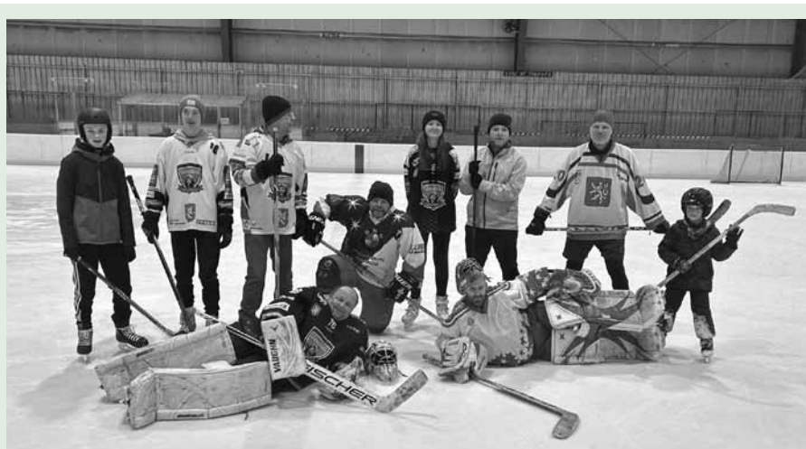
V neděli 24. 3. 2024 jsme se opět sešli v Jaroměři na zimním stadionu na jarním bruslení, zápas to byl vyrovnaný, vyhráli všichni.

Sledujte stránky obce. Facebook OBEC LEJŠOVKA, kde naleznete i fotografie z akcí. Nastražte uši při hlášení rozhlasu, aby vám ani jedna akce neutekla. tým kult. výboru Lejšovka